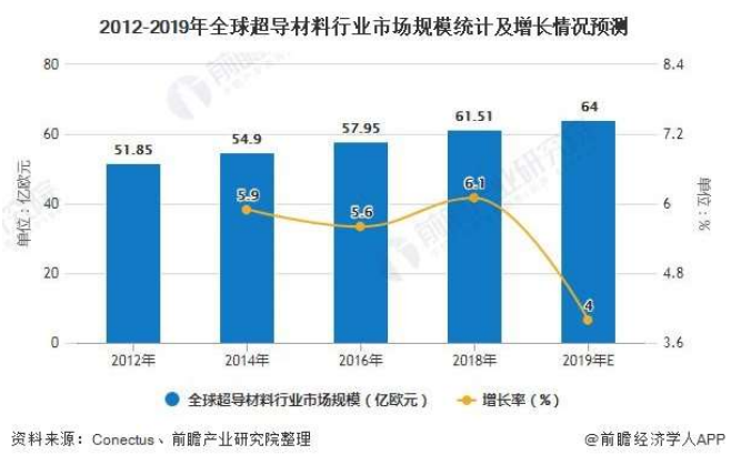
图 2012-2019 年全球超导材料行业市场规模统计及增长情况预测

随着全球超导技术的不断研发，以及超导在各个领域的应用规模不断扩大，全球超导行业已然进入火热年代。其中，超导材料是超导应用的基础，所以是最先产业化的部分，也是未来最具确定性的领域。